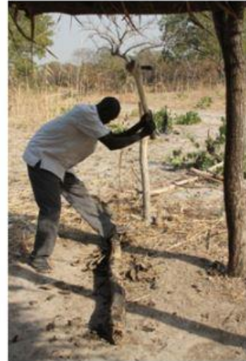
Les outils utilisés sont rudimentaires mais efficaces !