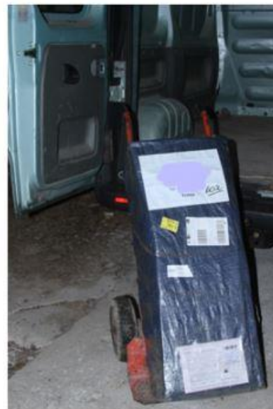
Arrivée du bois en France.

Vous êtes ici : Bois Equitable / Eco-participation