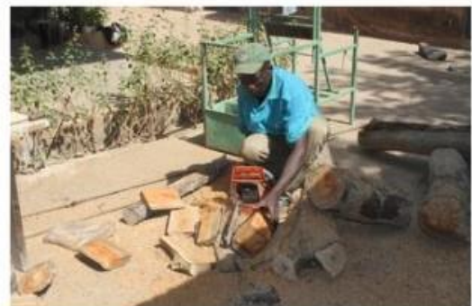
Une partie de l'éco-participation permet d'équiper ces ateliers et d'améliorer les conditions de travail.