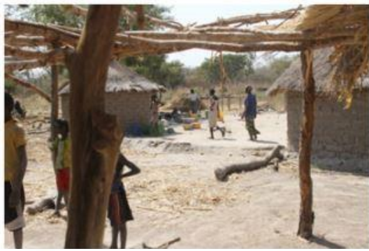
Petite structure familiale de Livara (Burkina Faso)