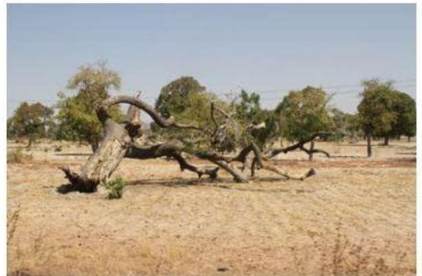
Dans la brousse et autour des villages, le bois mort est ramassé et utilisé comme bois de feu pour faire cuire les aliments.