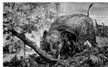
expédition Sarteau en Afrique

Ce bois est récolté et valorisé par des associations locales d'insertion par le travail, membres de la plateforme du commerce équitable . Palissandres, ébènes et divers bois précieux de la brousse sont ainsi transformés en ébauches pour l'artisanat d'art.