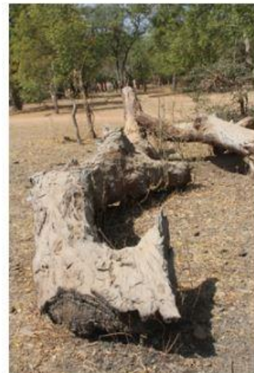
Souvent, les troncs, trop lourds, sont laissés sur place et abandonnés.