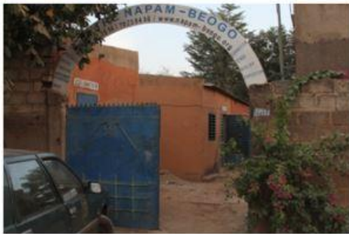
Le bois ramassé est ensuite acheminé jusqu'aux ateliers de l'association Il est découpé en chevrons puis en carrelés.