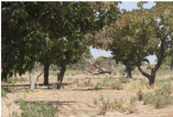
Des familles isolées dans la brousse, récoltent ce bois mort sous la direction de l'association Napam Beogo (voir lien).